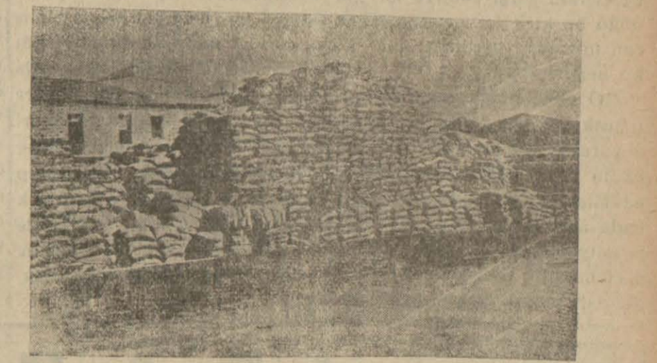
Mersinimizde liman hareketlerinden; istif edilmiş çuvalar

Yapmak, herhangi birşeyi yoktan var etmek; varı imar, islah, iyi bir hale getirmek, bir enerji eseridir. Ve takdire şayan bir harekettir.